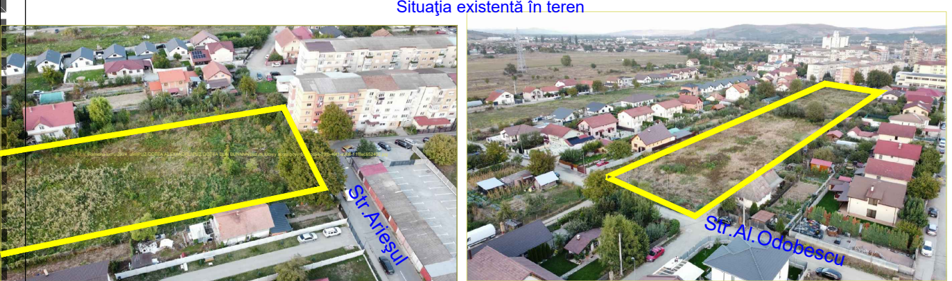
Situația existentă în teren